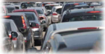
La réalité en 2018...