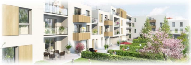
Ce que les promoteurs promettaient coté Parc