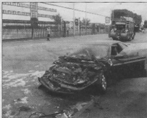
Plus de peur que de mal pour l'automobiliste et sa femme.

Un nouvel accident de la route s'est produit, samedi 21 août, quai de l'Industrie. Si la vitesse excessive en est à l'origine, les habitants des péniches dénoncent une nouvelle fois l'absence de ralentisseurs et une signalétique insuffisante.