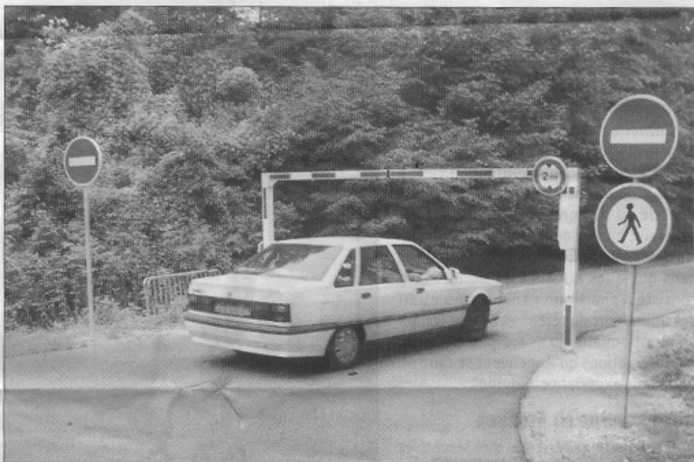
Un véhicule pris en flagrant délit de sens interdit, à proximité du carrefour d'Antin.

« Nous avons fait une campagne d'information dès le mois de juin pour avertir les riverains des dispositions consécutives aux travaux sur la N448. » répond Xavier Delrieu, commissaire de police à Draveil. Forts de cette campagne d'information, les policiers ont donc mené différentes opérations afin de dissuader les contrevenants d'emprunter la route forestière. En définitif, la récolte s'est révélée beaucoup plus fructueuses que prévu... « J'ai l'impression que certains policiers ont passé leurs