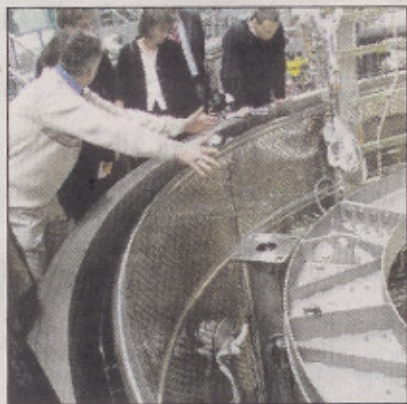
PLATEAU DE SACLAY. Fabrication d'aimants pour Neurospin qui sera l'une des plus puissantes IRM du monde.